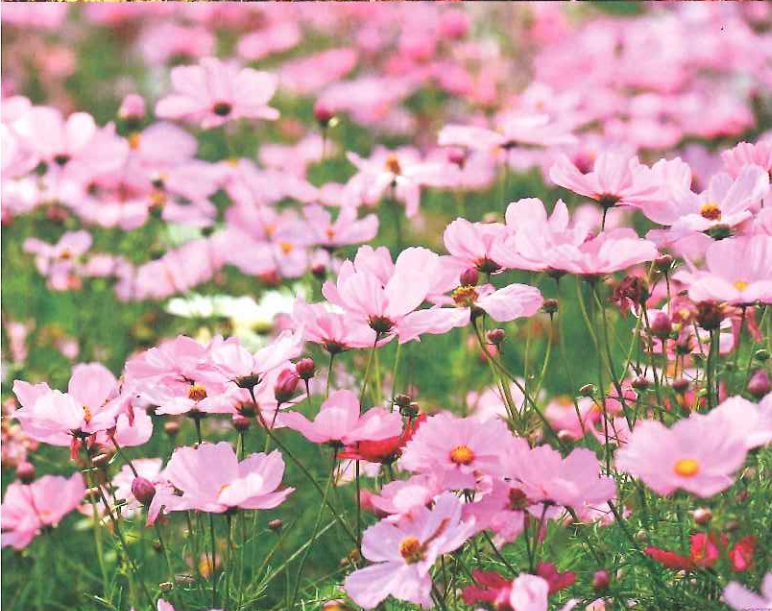
上: 紅葉・成田山公園 下: コスモス・基兵衛公園