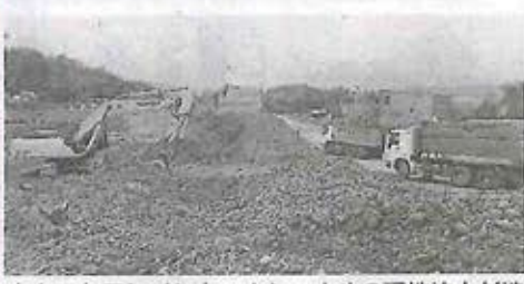
ネクストワンインターナショナルの現地法人が造成する新興住宅街(ベトナム北西部のラオカイ省)