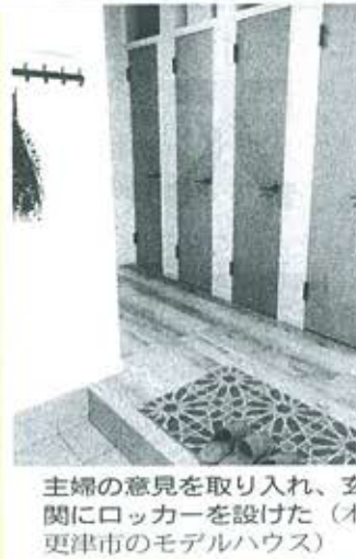
主婦の意見を取り入れ、 関にロッカーを設けた 木更津市のモデルハウス