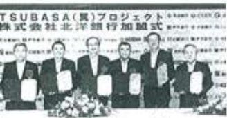
TSUBASA(株)プロジェクト 株式会社北洋銀行加盟式

千葉銀行は26日、地方 銀行6行による広域連携 「TSUBASA(翼) プロジェクト」に、北海 道が地盤の北洋銀行が参 加すると正式に発表し た。災害時の相互協力や 国際業務など、すでに連 携している分野に北洋銀 も加わるほか、勘定系シ ステムの共同化につい ても検討する。北海道ト ップの北洋銀の参加で、 連携の裾野の広がりが期 待できそうだ。