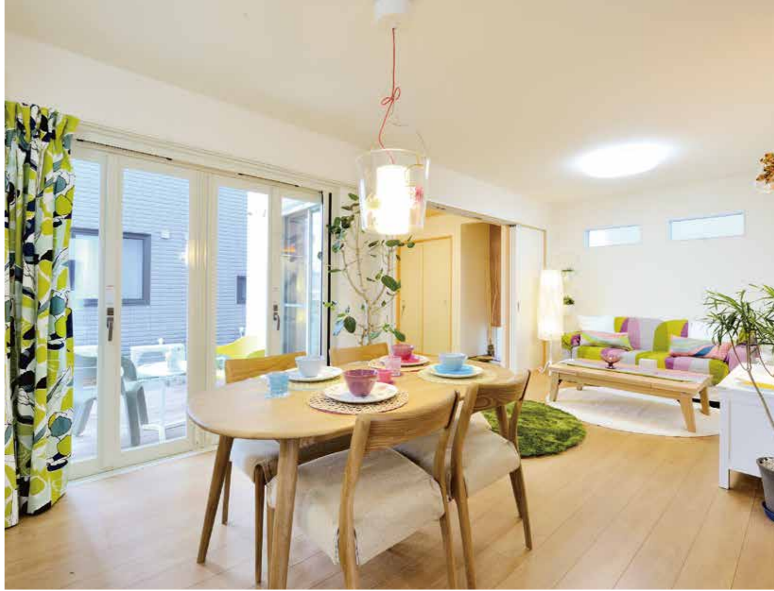
外とのつながりも意識した、家事や子育てがしやすいオープンな住まい (写真は新築施工実例。下の3点は千葉ショールーム)