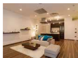
飾り棚など、きめ細かな要望にも対応