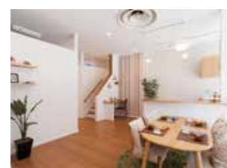
対面キッチンで、家族の会話も円滑に