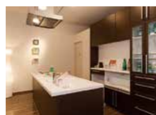
収納充実の主婦に嬉しいキッチンを提案