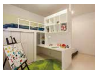
ベッドと机を一体化(千葉ショールーム)